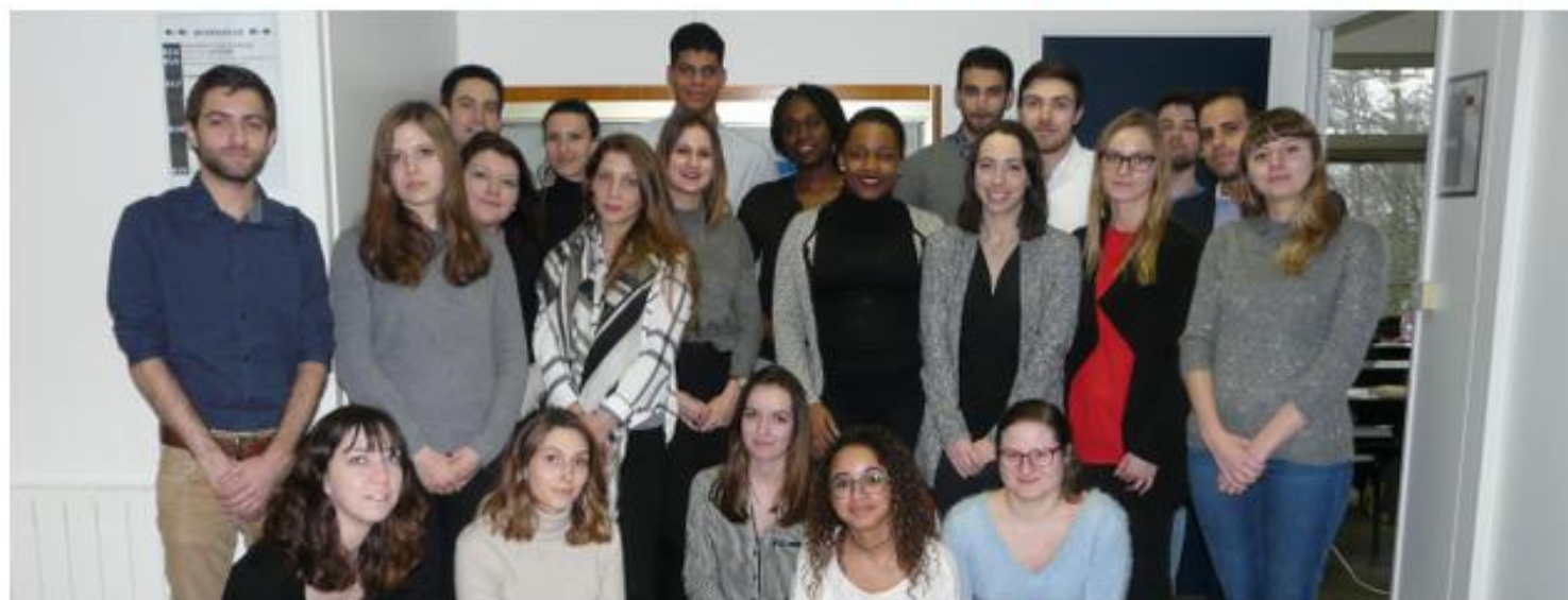
Les étudiants de l'IUT de Sceaux